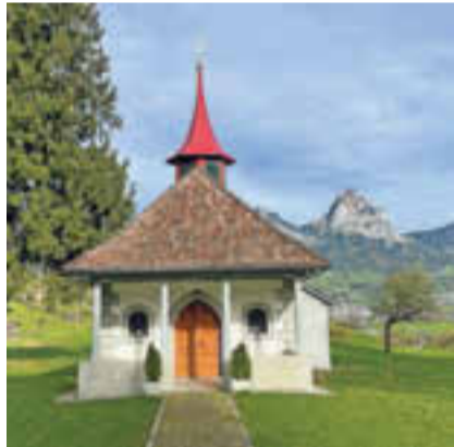
Die Kapelle Wylen wurde aussen und innen saniert.

Vor der Kapellgemeinde wurde in einer Abendmesse der sechs lieben Menschen gedacht, welche seit der letzten Kapellgemeinde für immer von uns gegangen sind. (pd)