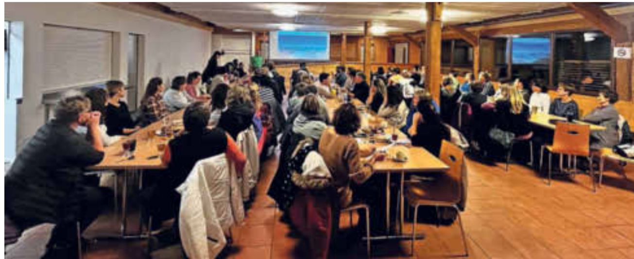
Die Besucherinnen folgten gespannt den Ausführungen der Referenten im «Märchtstübli» in Rothenthurm.

Experten referierten für die Bäuerinnenvereinigung zu diversen Themen.